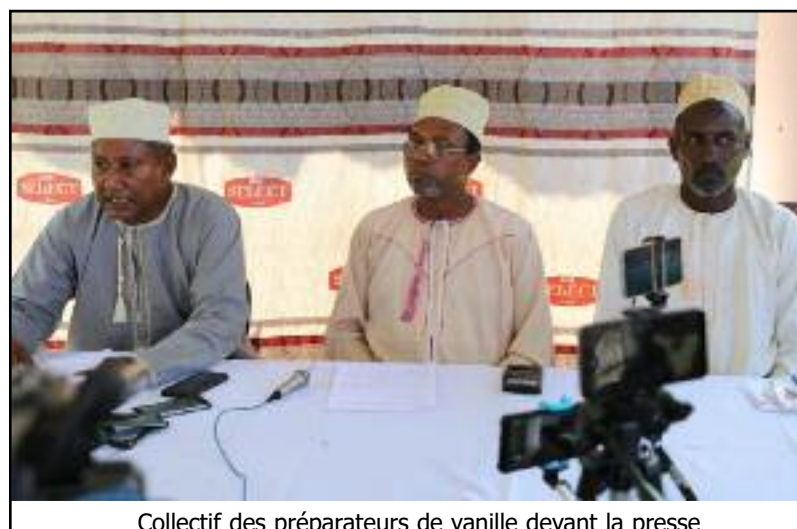
Collectif des préparateurs de vanille devant la presse