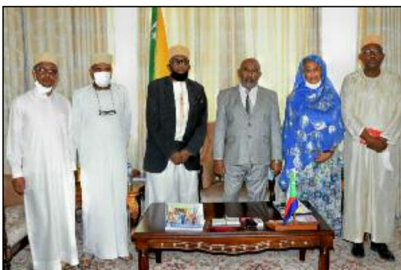
Collectif des préparateurs de vanille devant la presse