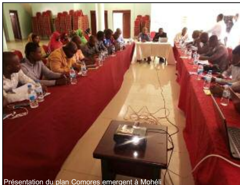
Présentation du plan Comores émergent à Mohéli