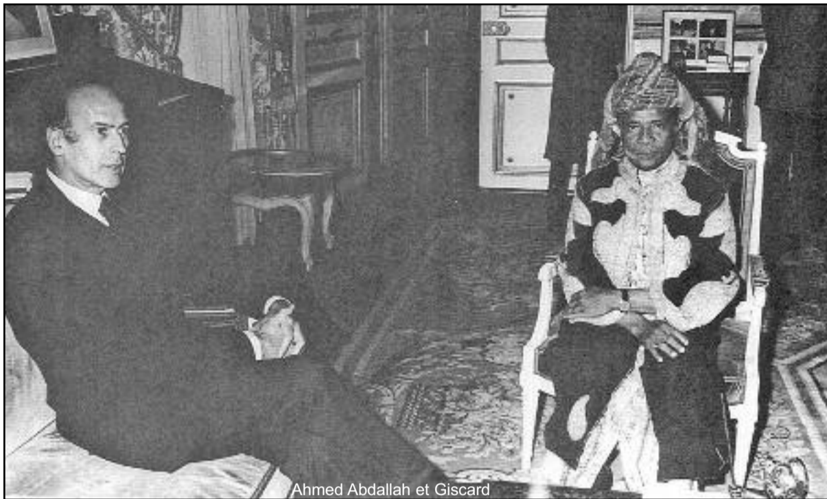
Ahmed Abdallah et Giscard

Il s'était même interrogé en ces termes « est-il raisonnable d'imaginer qu'une partie de l'archipel devienne indépendante et qu'une île, quelque soit la sympathie qu'on puisse éprouver pour ses habitants ait un statut différent ? ». Le président Giscard a eu à affirmer lors de sa deuxième réunion de presse le jeudi 24 octobre 1974, sur la politique extérieure au Palais de l'Élysée, que « les Comores sont une unité, ont été une unité et qu'il est tout à fait naturel que leur sort soit un sort commun ». Tout en exprimant bien les incertitudes de la politique française.